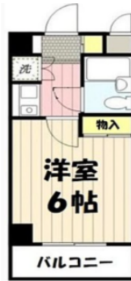
(写真のお部屋はアルバ相模原Ⅲです。)